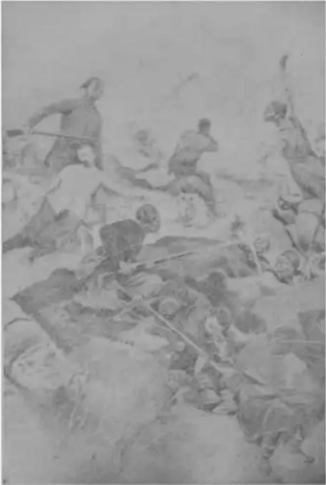
مقتل بریتونیه فی موقعه تجاوا فی أغسطس ۱۸۹۹